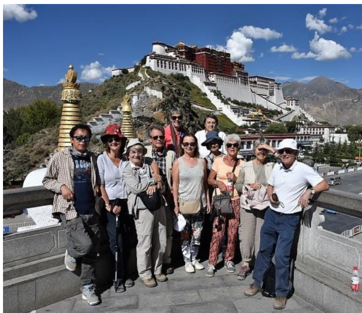
Devant le Potala

A l'initiative de la Société des Aquarellistes de Bretagne , en partenariat avec l'Association franco-chinoise du Morbihan, Rennes-Chine a organisé un voyage en Chine dans la région autonome du Tibet. Paysages magnifiques et surprenants, conditions de vie éprouvantes en raison de l'altitude (deux passages de cols à plus de 5000 mètres), rencontres chaleureuses avec les tibétains...Il nous restera des couleurs : bleu turquoise des lacs, blanc éclatant des glaciers, gris et ocres des chaînes de montagnes arides, habits multicolores des femmes, que nous tenterons de restituer avec nos pincesaux : à voir dans une exposition prochaine.